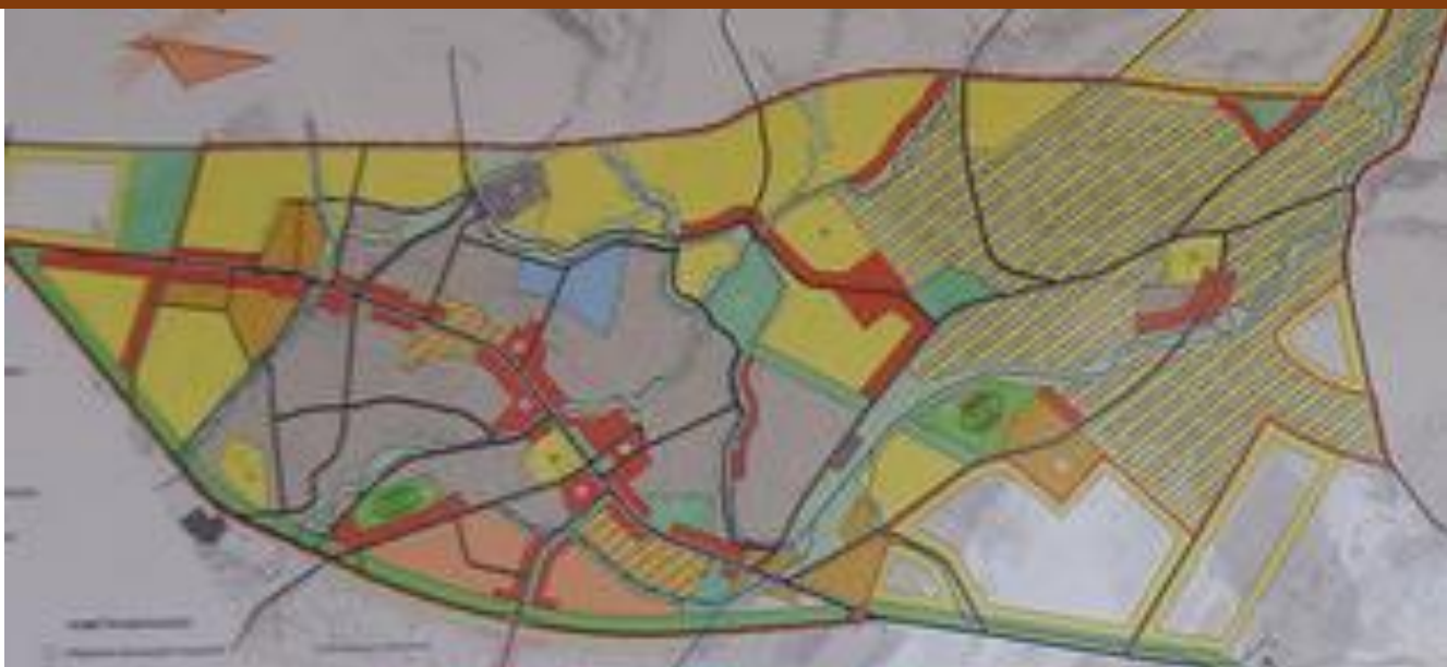
Рисунок 1 – Новый Генеральный план, разработанный ООО «Шахрофар» (от 30.04.12г.№186), функциональное зонирование района включает административный центр, жилые кварталы, приусадебные участки, торгово-общественные учреждения и сельскохозяйственные участки.

Географическое расположение и природно-климатические условия района оказывают значительное влияние на архитектурно-градостроительное развитие и формирование городской среды.