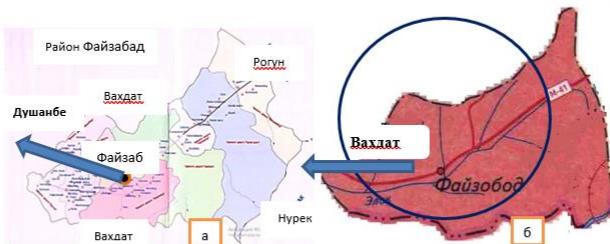
Рисунок 2 – а) карта с местоположением Файзабадского района республиканского подчинения относительно граничащих городов, б) граница района республиканского подчинения с указанием расположения города Файзабад, граничащего на севере и западе с городом Вахдат.