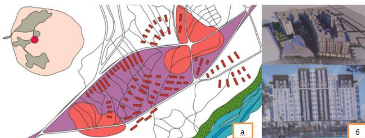
Рисунок 4 – а) предлагаемая концепция проекта детальной планировки с размещением многоэтажных, среднеэтажных, жилых и общественных объектов инфраструктуры б) предлагаемые жилые и общественные комплексы обслуживания

Архитектурный облик города отражает синтез традиционных таджикских строительных приёмов и элементов современной архитектуры (рис. 4,5 а-г.). Анализ планировочной структуры и архитектурный облик Файзабадского района позволяет выявить закономерности трансформации традиционной среды в условиях современных градостроительных процессов. Планировочная структура посёлка городского типа (пгт) Файзабад в период советской системы градообразования формировалась как линейная система. Застройка посёлка жилыми и общественными зданиями сформировалась как малоэтажная, состоящая в основном из одно-двухэтажных зданий вдоль главной дороги посёлка. В современном состоянии всё больше имеет приоритет в увеличении потребности жилищного строительства, формировании административно-делового центра, где предлагаются разрабатывать проекты детальной планировки (ПДП) с отдельными участками средней и многоэтажной застройки, рис.4,5.