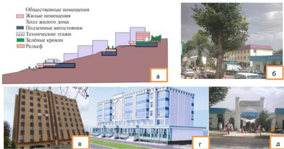
Рисунок 5 – а) предлагаемая концепция проекта детальной планировки с размещением многоэтажных, среднеэтажных, жилых и общественных зданий в разрезе, б) административное здание, в) 9-ти-этажный жилой дом, г) проект жилого дома со встроенным торговым и общественным центром, д) входные ворота центрального рынка Файзабад

Современное строительство медленно развивается, однако имеет потенциал к росту при условии правильного градостроительного планирования. На данный момент функционируют 58 школ, 40 средних, 7 основных, 11 начальных и 2 детских сада. Центральная районная больница на 175 коек, 2 участковые больницы, 27 медицинских пунктов и т.д. Учитывая изменения демографической ситуации района и высокий темп роста населения до 2020 года, возникает необходимость создания 4900 новых ученических мест в основных школах, 2300 ученических мест в дошкольных учреждениях, строительства и сдачи в эксплуатацию 99,0 тыс.м 2 жилых домов и создания 8,7 тысяч новых рабочих мест [9].